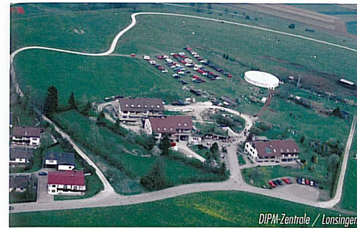
DIPM-Zentrale / Lonsingen

Wenn Sie eine Erbschaft oder eine Schenkung erhalten und diese, oder Teile davon, innerhalb von 24 Monaten der Stiftung zukommen lassen, ist dieser Betrag von der Erbschafts- bzw. Schenkungssteuer befreit. Bereits gezahlte Steuer wird vom Finanzamt erstattet.