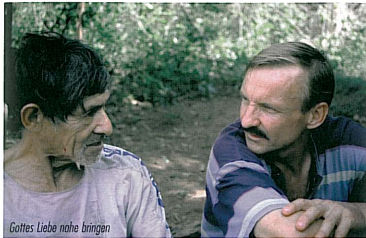
Gottes Liebe nahe bringen