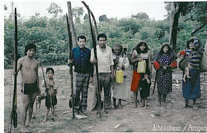
Ache-Indianer / Paraguay

Die DIPM, das sind zurzeit 54 Missionare in Paraguay und Brasilien, 13 Missionare und Mitarbeiter in Deutschland. Dazu kommen ca. 15 Kurzzeitmitarbeiter.